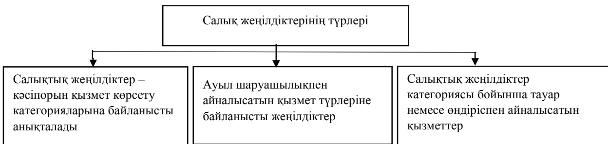
Сурет 1 – Салық жеңілдіктерінің түрлері

2. Екінші кезең – нормативтерге сәйкес салықтық жеңілдіктерді пайдалана білу арқылы кәсіпорын қызметтерін әртараптандыруға болады (1-сурет). 2017 ж. 25 желтоқсандағы қабылданған №120-VI ҚРЗ ҚР жаңа редакциядан өткен Салық кодексі 2018 ж. бастап қабылданған болатын. Бұл кодекске сәйкес салықтық шегерімдер мен басқа да салықтық жеңілдіктер қызмет түрлеріне байланысты жазылған [2]. Бұл заңнамалық өзгерістер мен толықтырулардың мақсаты – іскерлік органы жақсарту арқылы нарықта кәсіпкерлікті дамыту болып табылады.