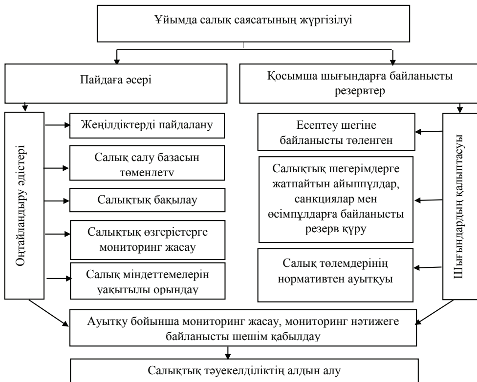
Сурет 3 – Салық саясатын оңтайландырылған моделі

Осында салықтық оңтайландырудың көзқарастар мен әдістерін дұрыс пайдалану, кәсіпорындарда жасалатын салық саясатының дұрыс жүргізілуіне байланысты 3-сурет.